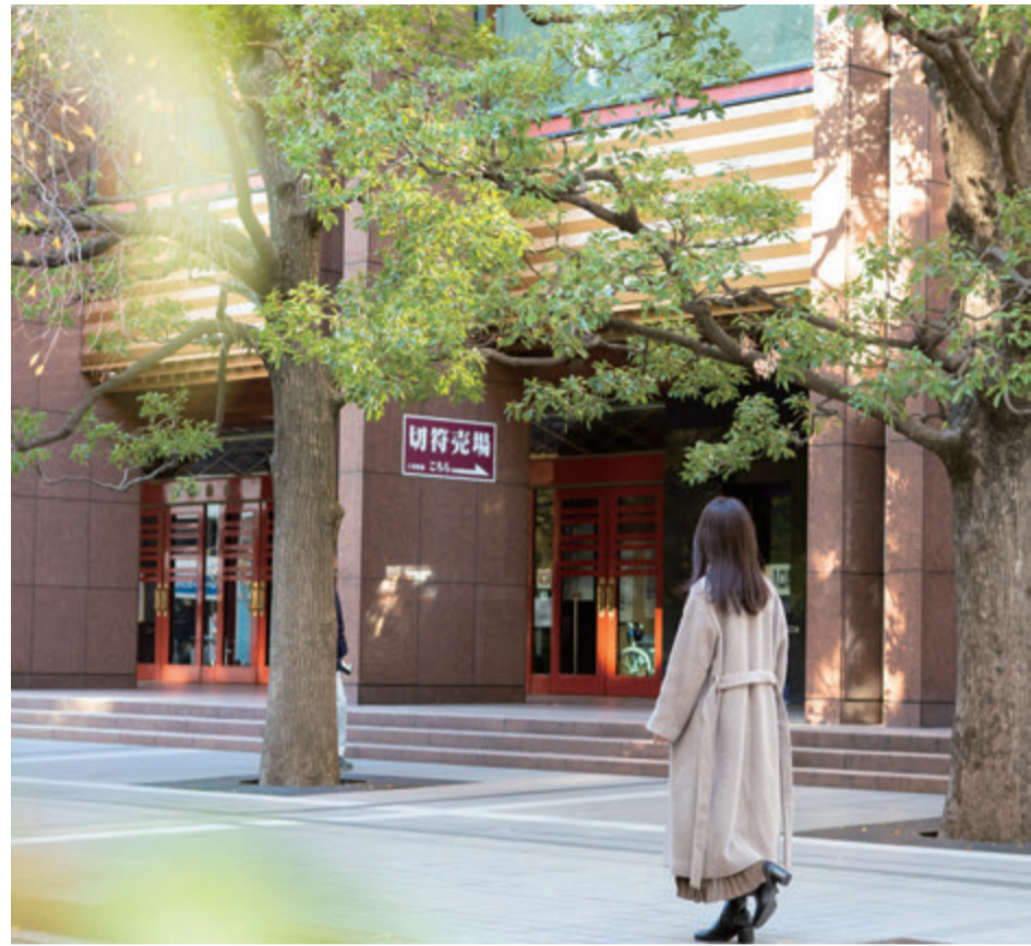
Text_Tomoko Hori