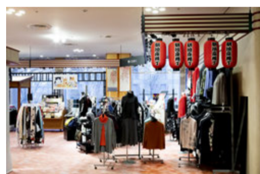
第二幕が終わり、静けさに包まれた客席内を出ると、そこには売店がずらり。「明治座横丁」は下町を彷彿とさせる賑やかな空間で、常時15店舗ほどが出店。土産物を中心に、お菓子や食品、雑貨や洋服まで、バラエティに富んだ様々な商品が販売されています。今回はその中から、明治座ならではの3店舗をピックアップ！