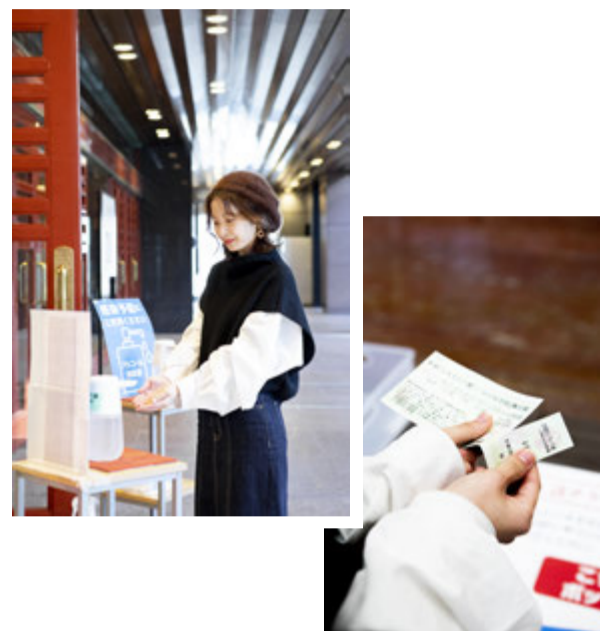
チケットは自分で取り切り半券をボックスへ

明治座は、都営新宿線「浜町駅」A2出口を出てすぐの場所にあります。この日観劇のチケットを手に劇場の中へ。換気、アルコール消毒、サーモグラフィーによる検温と新型コロナウイルス感染症対策も万全。開場時間は公演によって異なるので、事前に確認しておくのがおすすめです。