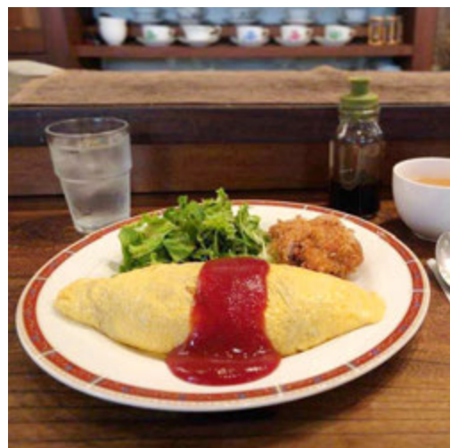
食べる人を虜にする。洋食店「flax」のオムライス @tsuchinoco22