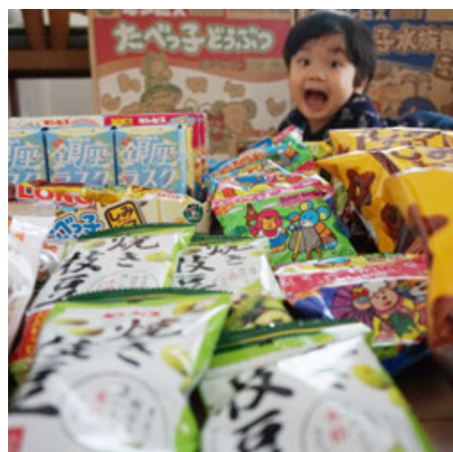
祝・浜町グルメグランプリ入賞！ 賞品は大好きなギンビスのお菓子 @green_peas_