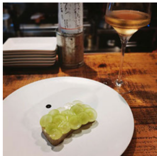
「富士屋本店」でいただくワインにぴったりの料理 @isolealunaname