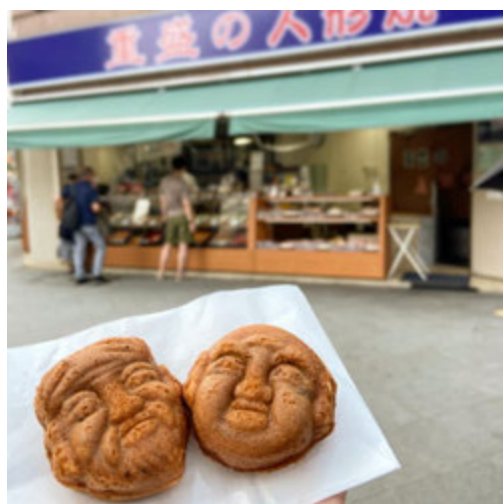
ぎっしりあんこがたまらない重盛永信堂の人形焼 @gourmet.momo