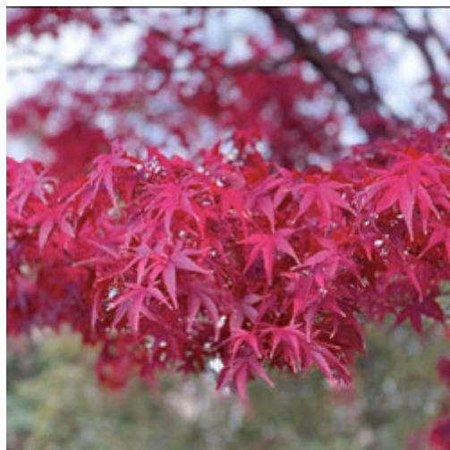
赤く染まる秋の浜町の景色 @pachirisa

よみがえる明治座東京喜劇 -ニッポン放送 「高田文夫のラジオビバリー昼ズ」全力応援!!-