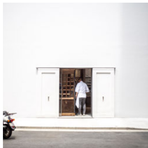
まちの話題スポット！T-HOUSE New Balance @16uki884

みんなが見つけた浜町界隈の素敵な風景を紹介するこの企画。『# 浜町写真倶楽部』、『# 日本橋浜町』がタグ付けされた SNS の投稿のなかから、BRIDGE 編集部が厳選しています！